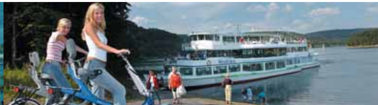
Fahrräder befördern wir kostenlos